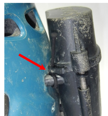
So wird der Deckel gesichert...