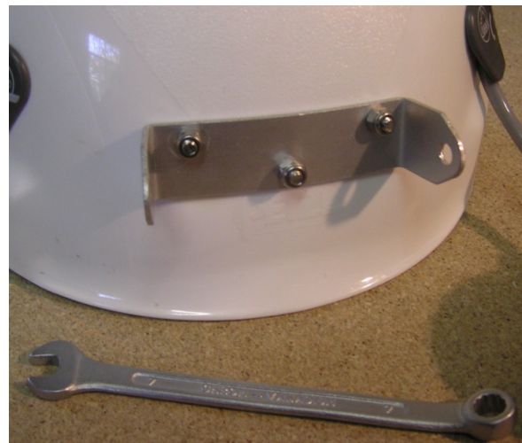
Fertig montierter Lampenhalter