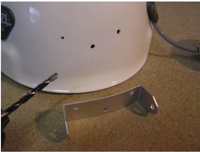
Préparation des trous pour le support de la lampe