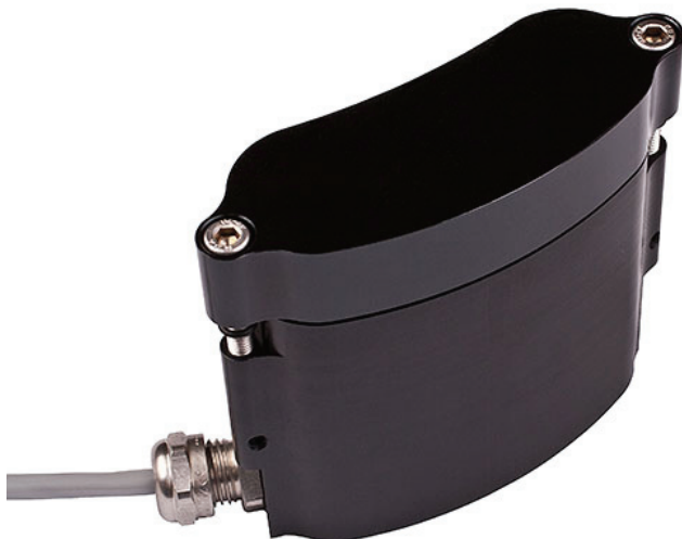
Boîtier à accus (modules)

La Scurion®-plongée est livrée éventuellement complètement installée et testée – c.à.d. que la lampe et le boîtier sont déjà branchés.