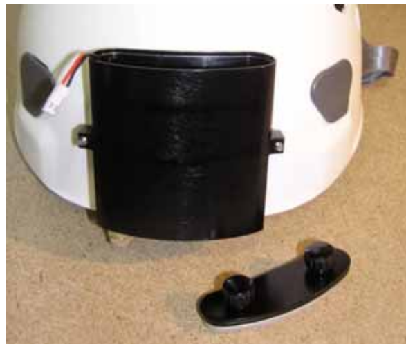
Caja de acumuladores montada