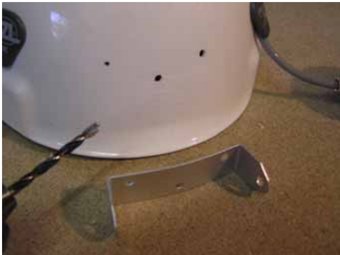
Preparación de los agujeros para el apoyo de la lámpara

Recomendamos colocar el cable de la lámpara a través del casco. Alternativamente los dos apoyos de plástico proporcionados, pueden ser utilizados para unir el cable en el exterior al borde del casco.