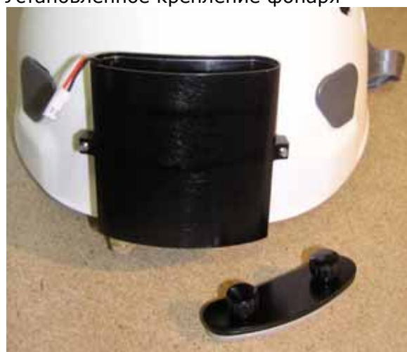
Установленный батарейный блок