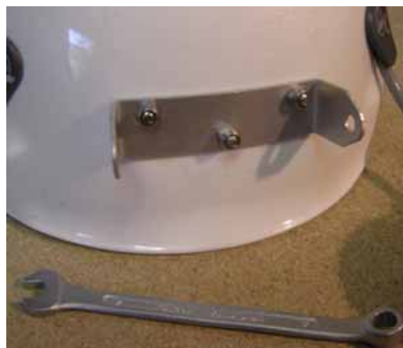
Zamontowany uchwyt do lampy