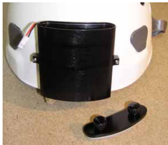
Zamontowany pojemnik na baterie