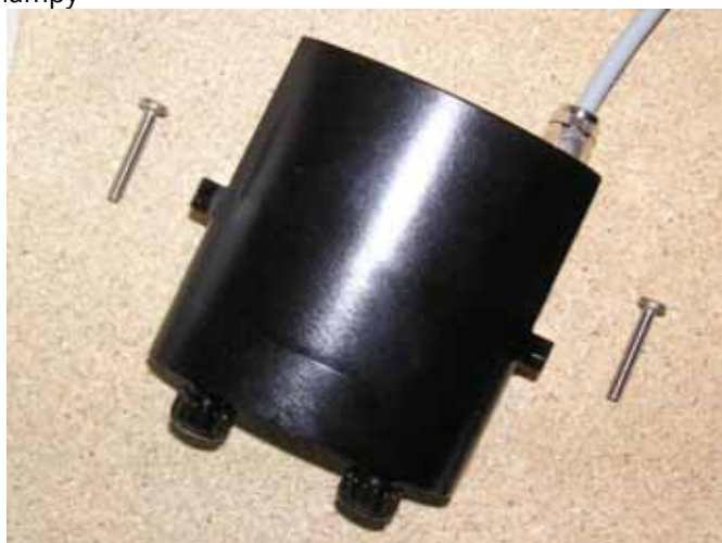
Pojemnik na baterie