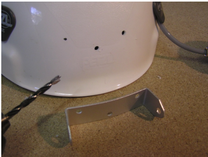
Fori preparati per il supporto della lampada