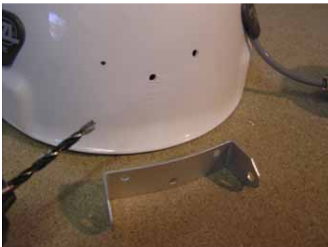
Gaten, geboord voor de lamphouder

Wij adviseren de kabel langs de binnenkant van de helm te leiden. Anders kunt u natuurlijk de twee meegeleverde plastic clips gebruiken om de kabel aan de buitenrand van de helm te bevestigen.